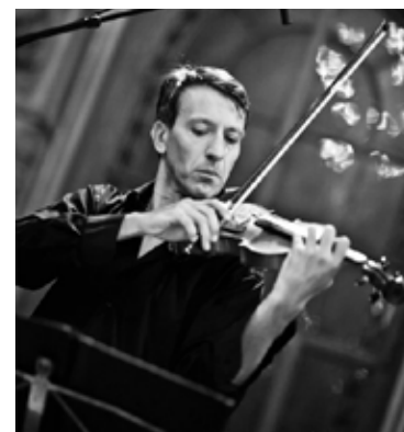
СКРИПАЧ SILENCIO TANGO ORCHESTRA